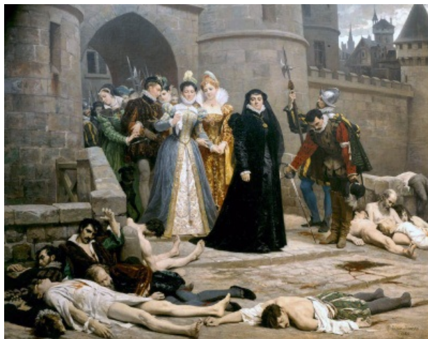
Королева-мать смотрит на тебя, как на убитых