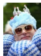
Бартенев смотрит на тебя как на провинциала