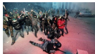
Украинская оппозиция троллит ментов

Евромайдан — массовые бессмысленные и беспощадные народные бурления и шевеления в Киеве на площади Независимости (укр. майдан Незалежності ), активно дающие метастазы в другие украинские города, распространяющиеся по этим вашим интернетам, захватывающие умы диванных теоретиков и политиков, а также политиков и экономистов реальных. Начались как протесты по поводу отказа от объединения с ЕС на невыгодных для Украины условиях, но в январе 2014 г. переросли в беспорядки, свержение легитимного президента и установление власти толпы, которая назначила в органы власти своих людей, преимущественно радикальных националистов и откровенных бандитов, а ныне приведшая Украину к расколу. Данные выступления являются реализацией состояния агонии украинского народа, полностью отражающего суть человека, объединившихся под желто-голубым флагом. Да и остальных тоже.