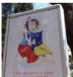
Нетрадиционные сексуальные отношения

Боевая часть переворота пришлась на неудобный момент — недалеко от Украины, в Сочи, принимали Олимпиаду. По негласным нормам в это время было не комильфо бряцать оружием и захватывать государства. При этом пара украинских спортсменов в знак солидарности с Майданом (а также по причине бесперспективности) снялись с соревнований. Посему похода на Украину не случилось — власти РФ позволили себе только «внезапную проверку боеготовности» войск Западного и Центрального ВО, которая прошла аккуратно между Олимпиадой и Паралимпиадой.