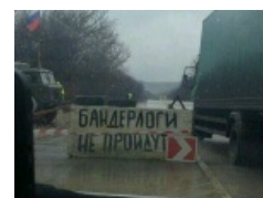
Главный лозунг антимайдановцев