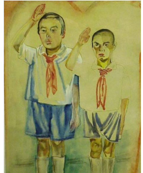
Собирательный образ советского пионера