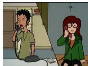
Классика жанра (бумп)

Деловое общение с помощью телефона помогает быстро решать текущие вопросы без необходимости личного присутствия, например, когда требуется оперативно позвонить в центральный офис брокерской конторы и выяснить куда со счёта пропала n-ная сумма денег, после чего принять извинения в ошибке сотрудников и уверения в денежной компенсации, если уважаемый клиент (то есть Вы) замнёт вопрос. Есть и множество других моментов, когда телефонные разговоры возбуждающе-увлекательны с деловой точки зрения.