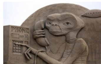
Уэстонский фестиваль песчаных скульптур, 2013 год